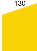
Tabela 12. Status firm z grupy badanej i grupy kontrolnej w momencie realizacji badania..... 104

Tabela 11. Poziom wskaźnika rezultatu osiągniętego na dzień 31.03.2021 r. w ramach priorytetu inwestycyjnego 8iii. .... 103